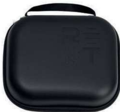
Портативный зарядный кейс