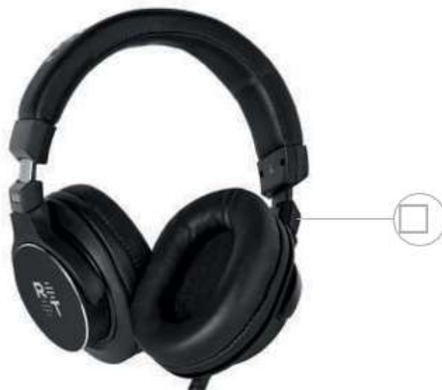
Поворотный механизм амбушюр