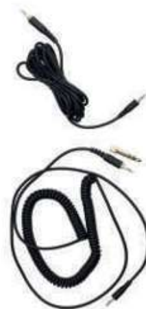
Кабель витой 1,5-4 м Кабель прямой 3 м Переходник 3,5 мм на 6,3 мм