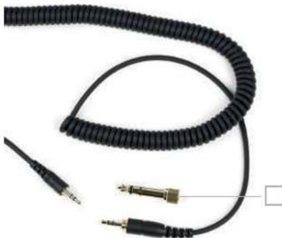
Винтовой штекер для переходника