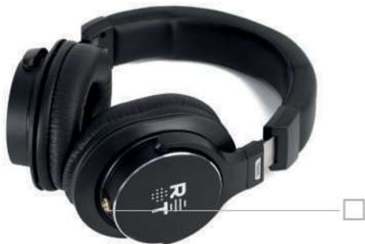
Входной штекер для провода